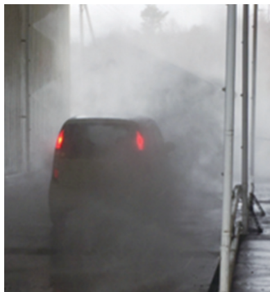
車両消毒でも相乗効果が期待できます

衛生管理区域内に入る車両消毒（飼料搬入、薬品搬入、鶏の搬入・搬出、 機材の搬入・搬出）。車両のフロアーマット、車内、車両荷台。